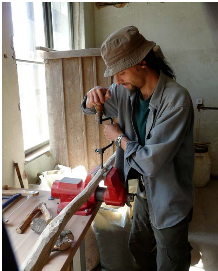
Nahoře vlevo: Motocestování po Evropě. Dole vlevo: Výroba kosišť s přáteli. Vpravo: A ještě jednou výroba kosiště, tentokrát v dílně.

hlavně jako zprostředkovatel. Vzniká taková jedna velká bytost složená z nás všech a já, jako lektor, s tou energií vědomě i podvědomě pracuji, aby tam proběhlo to, co proběhnout má. Mám sice osnovu a dávku informací, kterou předávám na hlavové úrovni vždy skoro stejně, ale je toho za slovy a mezi slovy ještě mnohem víc. A často to není ani o zahradách, mám pocit, že mnoho lidí si chodí pro posuny na hlubších úrovních své bytosti. Snažím se, aby každý dostal, pro co si přišel, a není to většinou na úrovni myslí a nemusí to být ani příjemné. Každopádně je to vždy něčím prospěšné. Kolik je tam lidí, tolik tam bude i názorů na to, jaké to bylo. Myslím, že není náhoda, že někdo je součástí zrovna jedné skupiny v daném okamžiku svého života a někdo zase jiné. A kam se já posunuji? K ještě větší vnitřní svobodě a hojnosti. Pracuji na novém typu semináře zaměřeného na soběstačnost s širokým záběrem od ryze materiálních metod k zajištění si živobytí až po nejhlubší niternou práci, jejímž cílem je vnitřní volnost a hojnost na všech úrovních. Myslím si totiž, že hmotu a duchovno (alias neviditelnou tvůrčí energii) nelze od sebe oddělit a že naše mysl a pocity vytvářejí naši realitu. Těším se na ty, kteří budou mít odvahu na takový kurz přijít.